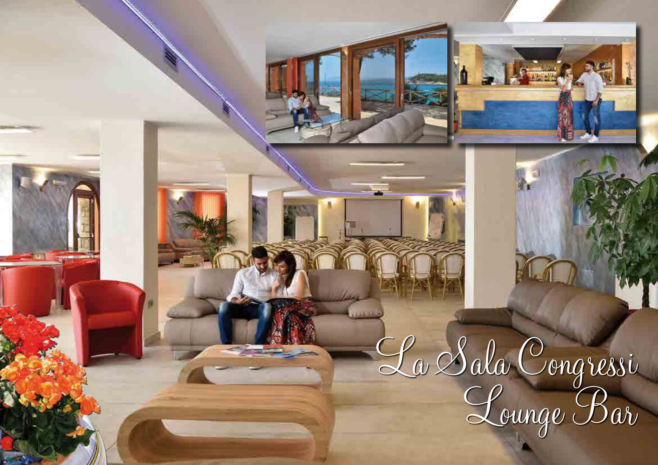
La Sala Congressi Lounge Bar